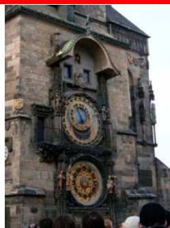
Prága: „Orloj” - Óratorony