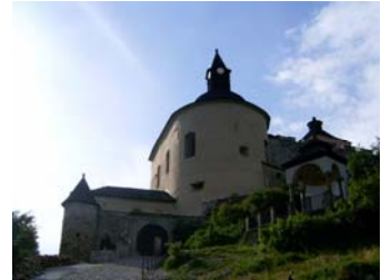
„Krasznahorka büszke vára”